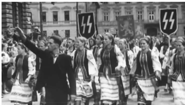
Přehlídka příslušníků divize Waffen SS „Halič“ ve Lvově 18. července 1943

Nejvyšší soud Ukrajiny definitivně a bez práva na odvolání zrušil rozhodnutí Norimberského tribunálu a uznal, že jejich symboly (a následně ani jejich aktivity) nejsou nacistické. Jaká je to symbolika můžeme vidět na obrázku. (23:46, 5. 12. 2022)